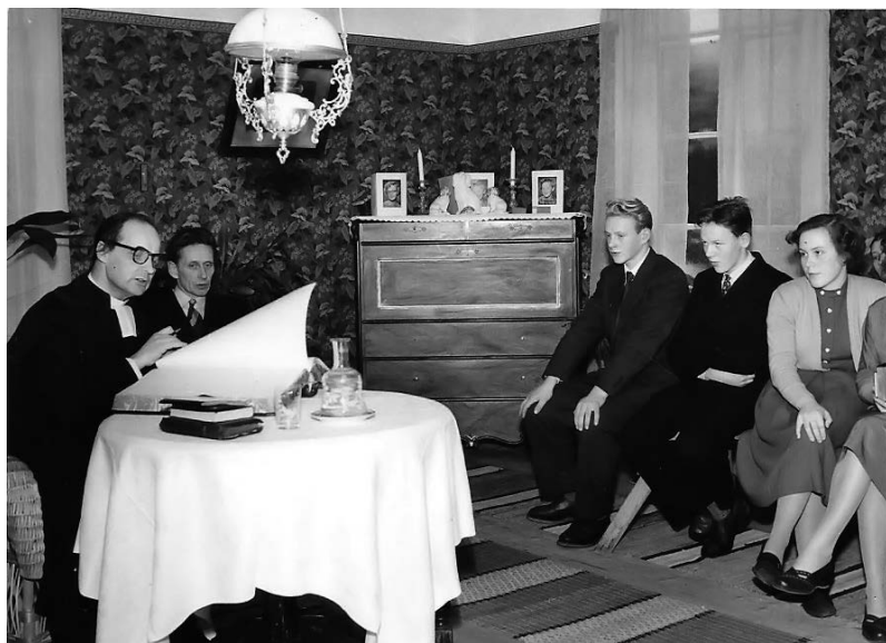
Läsförhör på Södergårds i Tärnebolstad 1953.