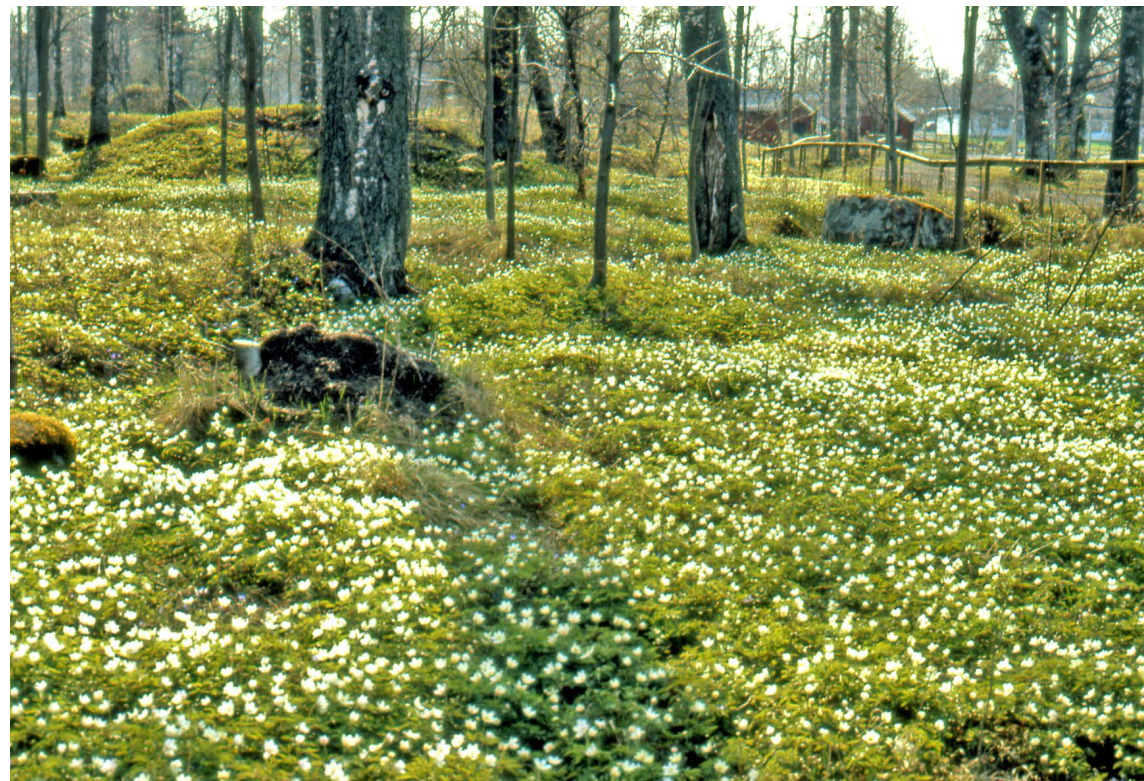
Den åländska naturen inspirerade Valdemar Nyman i smått och i stort.