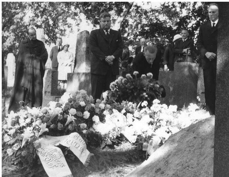
Jordfästning i Finström.