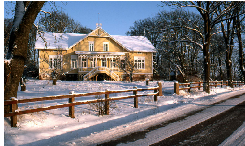
Finströms prästgård i vinterskrud.

naturligt utflöde, kanske något som har att göra med mitt småslarviga sätt, låt oss säga generositet. Det mesta omkring oss är i allmänhet för knappt, för stramt, för hårt. Jag vill något slösande rikt.