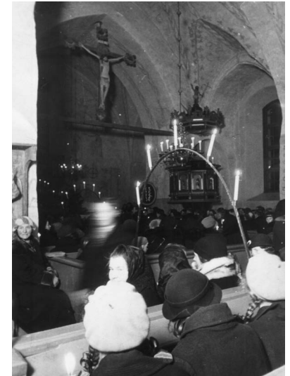
Som nyvigd präst i Finström. Åsa Nymans familjealbum. Finströmsborna fick vänja sig vid prästens nymodigheter.

strömmarna blev hans eget hemfolk. 91 Redan 1939, fyra år efter hans tillträdande, konstaterar en redaktör på tidningen Åland: "Numera ångrar nog ingen valet." 92