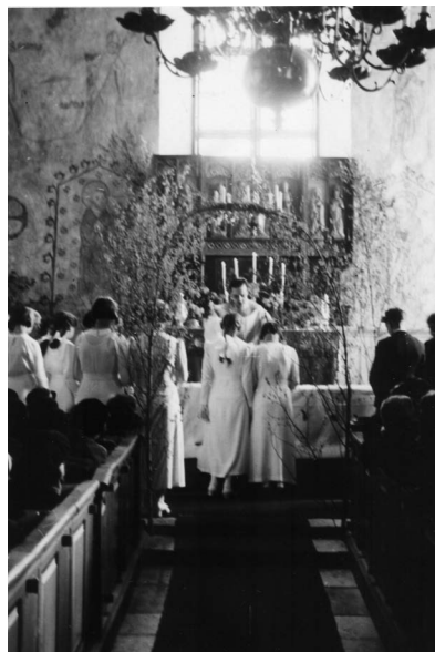
Konfirmation i Finströms kyrka.

naturligt utflöde, kanske något som har att göra med mitt småslarviga sätt, låt oss säga generositet. Det mesta omkring oss är i allmänhet för knappt, för stramt, för hårt. Jag vill något slösande rikt.